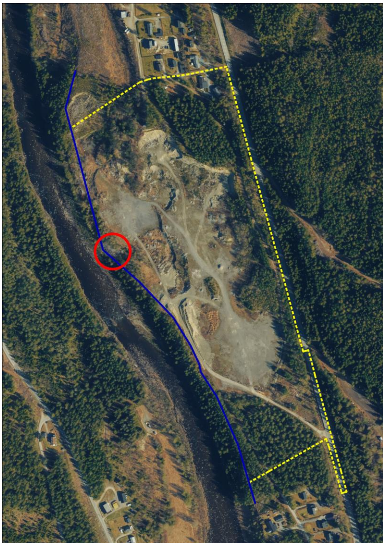
Figur 5. Utsnitt som viser utstrekning av Dokkajuvet Naturreservat (blå linje) med lokalisering av eksisterende steinplastring (rød sirkel). Gul stiplet linje er planavgrensning.