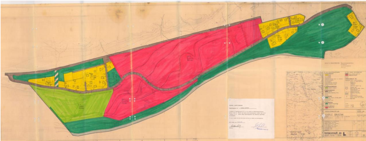
Figur 2. Gjeldende reguleringsplaner varsles opphevet.

Sammen med høring av ny reguleringsplan for planområdet blir eksisterende plan fra 1987 varslet opphevet.