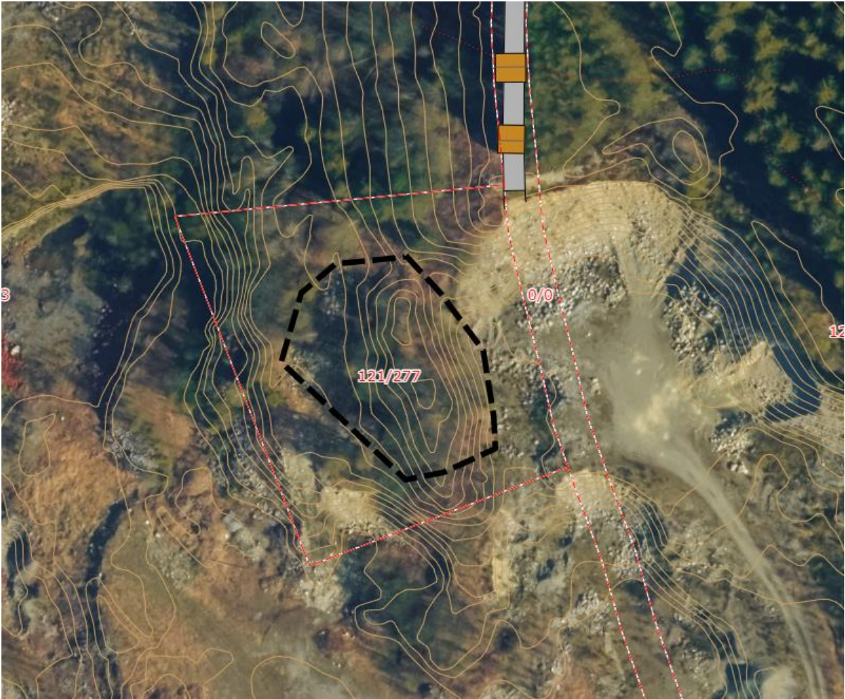
Figur 5. Utsnitt av flyfoto med grenser for deponi.